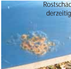
Rostschäden am derzeitigen Bus

Vor sieben Jahren hat der Förderkreis Sumy-Hilfe kräftig gesammelt und es konnte ein Kleinbus für die tägliche Beförderung zur Schule gekauft werden. Für viele Schüler ist eine Fahrt mit öffentlichen Transportmitteln nicht möglich. Jeden Schultag ist der Bus etwa 120 km auf schlechten Straßen unterwegs. Inzwischen