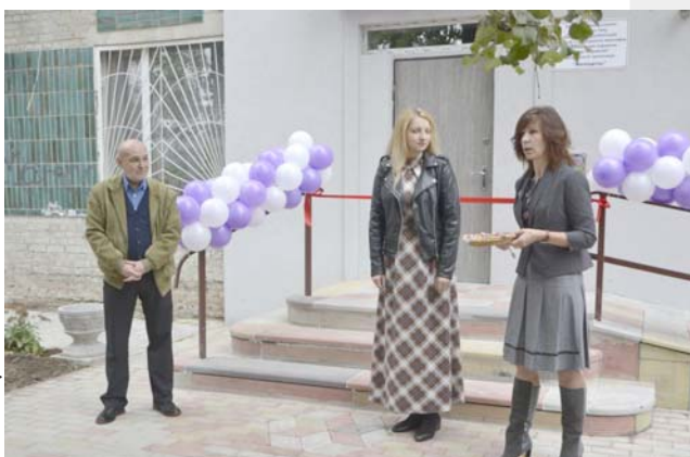
Bei der Eröffnung der Miniwerkstatt

Ich wurde im Sommer mit neuen Eindrücken beschenkt, denn die Bilder in meinem Kopf aus dem Frühjahr erinnerten doch sehr an einen Rohbau und