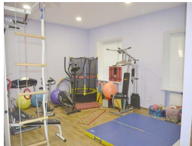
Der Sportraum in der Miniwerkstatt

waren verbunden mit bürokratischen Komplikationen. Doch wie ein russisches Sprichwort sagt: „Терпение и труд всё перетрут“ (Geduld und Arbeit zermahlen alles). Und so wurde