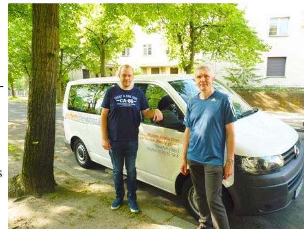
Die Fahrer des Wichernheims beim Spendentransport nach Sumy 2018