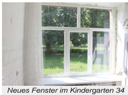
Neues Fenster im Kindergarten 34

darf beim Austausch hunderter Fenster berichtete, riefen wir eine dauerhaft angelegte Spendenaktion ins Leben. In jedem Bereich von Wichern stehen jetzt kleine Spendenhäuschen aus Keramik, die über das ganze Jahr mit kleinen Beträgen der Betreuten, der Beschäftigten, Klienten und Mitarbeiter gefüllt werden. Manche Mitarbeiter gaben auch größere Einzelspenden und oft ist auch die Kollekte aus den Gottesdiensten in unserer schönen Wichernkapelle für Sumy bestimmt. Vor Beginn des Spenden transports wird dann alles gezählt und der Vorstand hat die, auf diese Weise gesammelte Summe dann meist verdoppelt bzw. deutlich aufgestockt. So konnten wir in jedem Jahr zwischen 2.000 bis 3.000 € für den Bau neuer Fenster und die sonstigen Bedarfe im Kindergarten 34 mit auf die Fahrt nehmen.